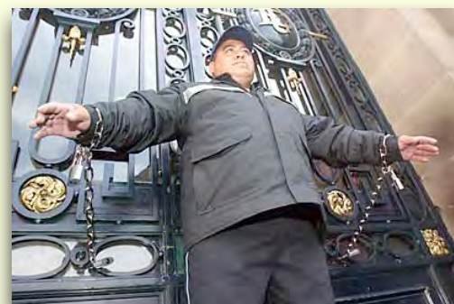
Un policía de la Ciudad de México se encadena a las puertas principales de la Asamblea de la Ciudad en protesta porque su salario no es un salario digno (19 de diciembre de 2006).

Un salario digno es, universalmente, el elemento más importante en el logro del derecho de todos a una vida digna y a la erradicación de la pobreza. En relación a la responsabilidad social de las empresas, una corporación o entidad organizacional que emplee a personas, independientemente del tamaño o el giro, pública o privada, no puede ser considerada con un comportamiento socialmente responsable si no paga un salario digno, no importa qué tan responsablemente se comporte en todas las demás áreas de su actividad.