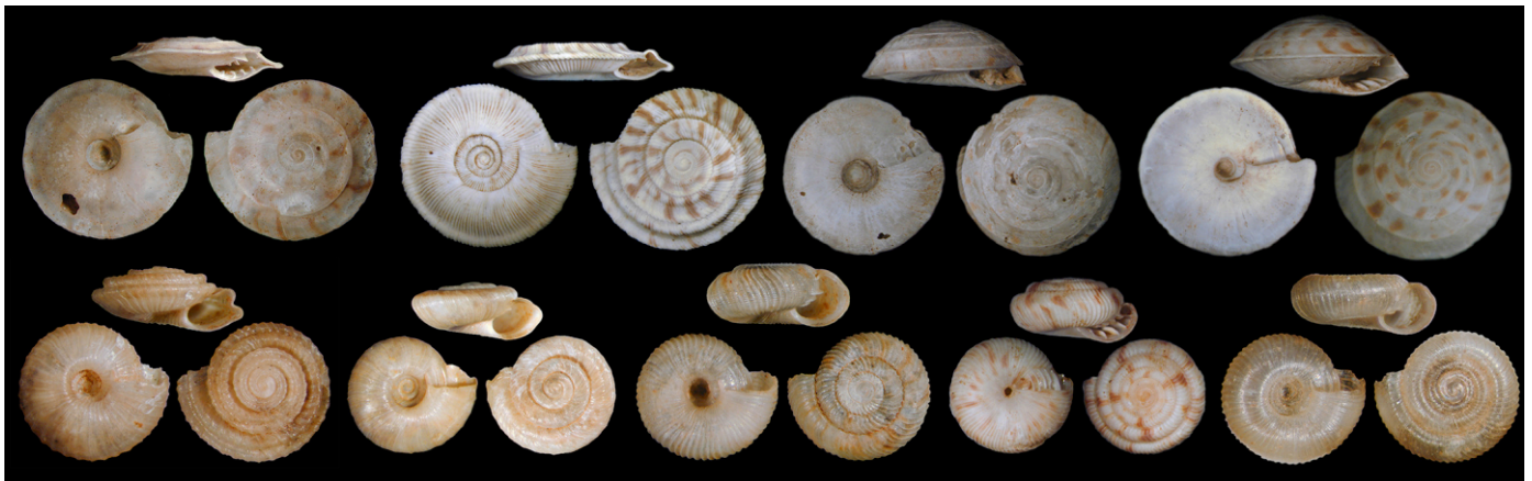
Fig. 4: Endodontidae recientemente extinguidos de Rurutu (Islas Australes, Polinesia Francesa).

estudios han revelado una fauna recientemente desaparecida (Fig. 5), y se han descrito especies nuevas para la ciencia, aunque ya extintas (por ejemplo, Christensen, 1982; Abdou & Bouchet, 2000; Bouchet & Abdou, 2001; Zimmermann, Gargominy & Fontaine, 2009; Richling & Bouchet, 2013; Sartori, Gargominy & Fontaine, 2013, 2014; Gerlach, 2016; Christensen, Kahn & Kirch, 2018) (Fig. 4). Los insectos u otros artrópodos, muchos de los cuales no dejan restos identificables, generalmente no pueden proporcionar una visión de las extinciones recientes como pueden hacerlo los moluscos, a menos que se utilicen métodos de análisis de muestras que exigen mucho tiempo (por ejemplo, la extracción de núcleos en pantanos), en cuyo caso pueden revelarse extinciones recientes de insectos y sus posibles causas (por ejemplo, Whitehouse, 2004, 2006; Craig & Porch, 2013; Porch & Smith, 2017). No obstante, muchos insectos se conservan en ámbar (Poinar, 1993) y otros son bien conocidos de, por ejemplo, depósitos lacustres, depósitos de turba de pantanos y turberas y filtraciones de petróleo (Durden, 1966; Elias, 1991; Smith & Moe-Hoffman, 2007; Smith & Marcot, 2015; Holden et al., 2017).