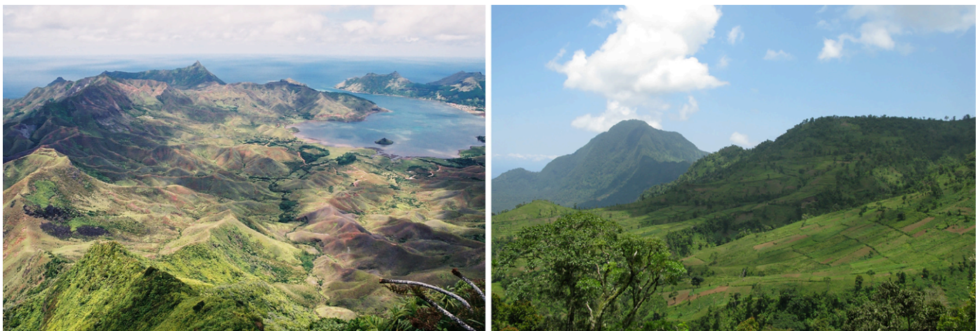
Fig. 6: Derecha: Las islas tropicales como Anjouan, en las Comoras, han sufrido una extensa deforestación para la agricultura. La vegetación autóctona suele faltar por completo en las altitudes más bajas, y las crestas y cimas de las montañas más altas son ahora los últimos refugios de las especies endémicas que quedan. Izquierda: Otras islas, como Rapa, en las Islas Australes (Polinesia Francesa), que tiene una superficie de sólo 40 km 2 y solía tener más de 100 especies endémicas de caracoles terrestres, 59 especies endémicas de plantas y 67 especies endémicas de gorgojos, son ahora en su mayoría estériles. Los incendios y el sobrepastoreo de herbívoros introducidos han destruido gran parte del hábitat de las zonas altas, y la vegetación de las zonas bajas está dominada por especies invasoras.