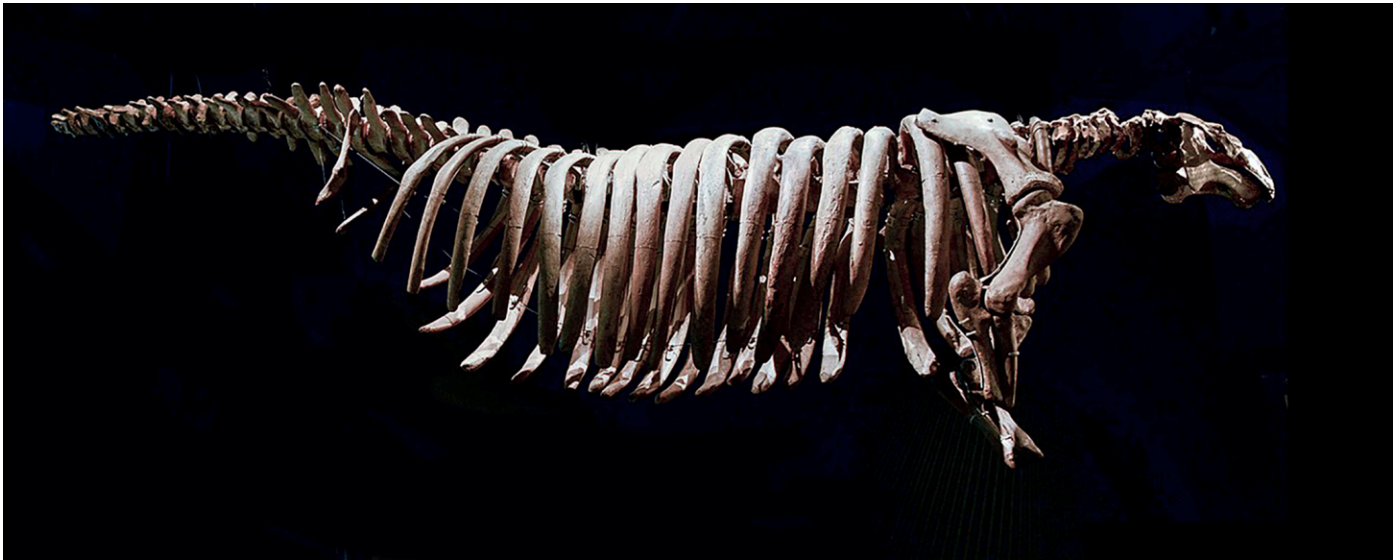
Fig. 6: Vaca marina de Steller ( Hydrodamalis gigas (Zimmerman)), una de las pocas extinciones marinas documentadas, esqueleto en el Musée des Confluences, Lyon.

Más allá de la Lista Roja, hay en efecto casos adicionales de especies marinas declaradas extintas (por ejemplo, Carlton, 1993; Peters et al., 2013; White, Kyne & Harris, 2019; Tenorio et al., 2020), y Gravili et al. (2015) incluso especularon que de 53 especies de hidrozoos mediterráneos no registradas en la literatura en los 41 años anteriores, el 60% (es decir, 32 especies) podrían ser declaradas extintas. Al igual que en tierra, las especies declaradas extintas también pueden ser redescubiertas (de Weerd & Glynn, 1991; Glynn & Feingold, 1992; Díaz, Gast & Torres, 2009).