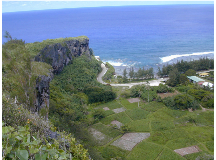
Fig. 5: Rurutu (Islas Australes, Polinesia Francesa) fue antaño el hogar de 19 especies endémicas de Endodontidae (Mollusca). A pesar de las búsquedas exhaustivas en las manchas de vegetación autóctona que quedan, como al pie de este acantilado, sólo se encontraron conchas vacías. En la actualidad, las 19 especies se consideran extinguidas.

Si suponemos que (i) las 200 especies de caracoles terrestres muestreadas por Régnier et al. (2015a) son representativas de la diversidad conocida de invertebrados no marinos y de su tasa de extinción (hay que reconocer que es una suposición atrevida), (ii) tres cuartas partes de las especies son no marinas (Mora et al., 2011), y (iii) las extinciones marinas son insignificantes en comparación con las no marinas, entonces aproximadamente el 7,5-13% (150.000-260.000) de todos los ~2 millones de especies se han extinguido desde alrededor de 1500. Esta cifra es muy superior a las 882 especies (0,04%) que la UICN considera extintas (2020). Pero, ¿se trata de una crisis de la biodiversidad o incluso de la sexta extinción masiva?