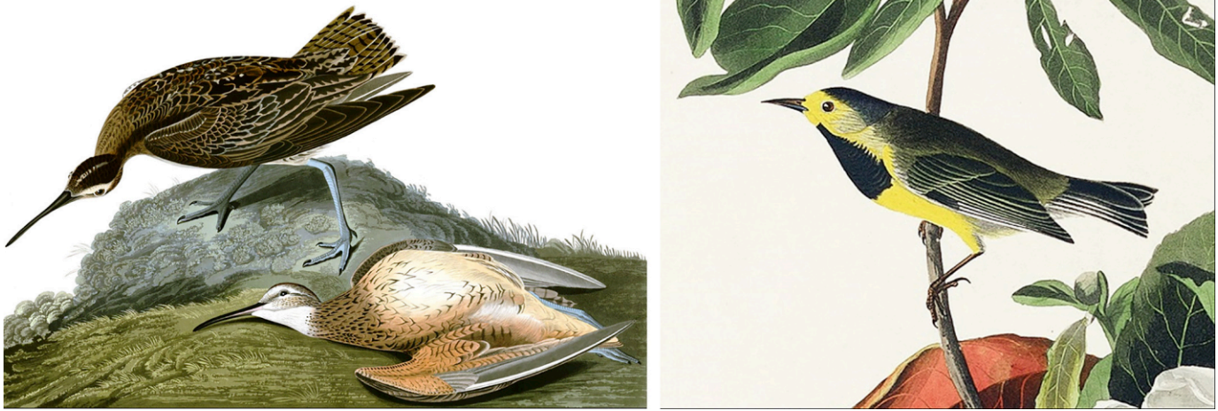
Fig. 2: Extinto pero no catalogado como tal, por temor a cometer el "error de Romeo". Izquierda: Zarapito esquimal ( Numenius borealis (Forster)), de Audubon (1827-1838: lámina 208;). Derecha: Curruca de Bachman ( Vermivora bachmani (Audubon)), de Audubon (1827-1838: lámina 185 (detalle);).