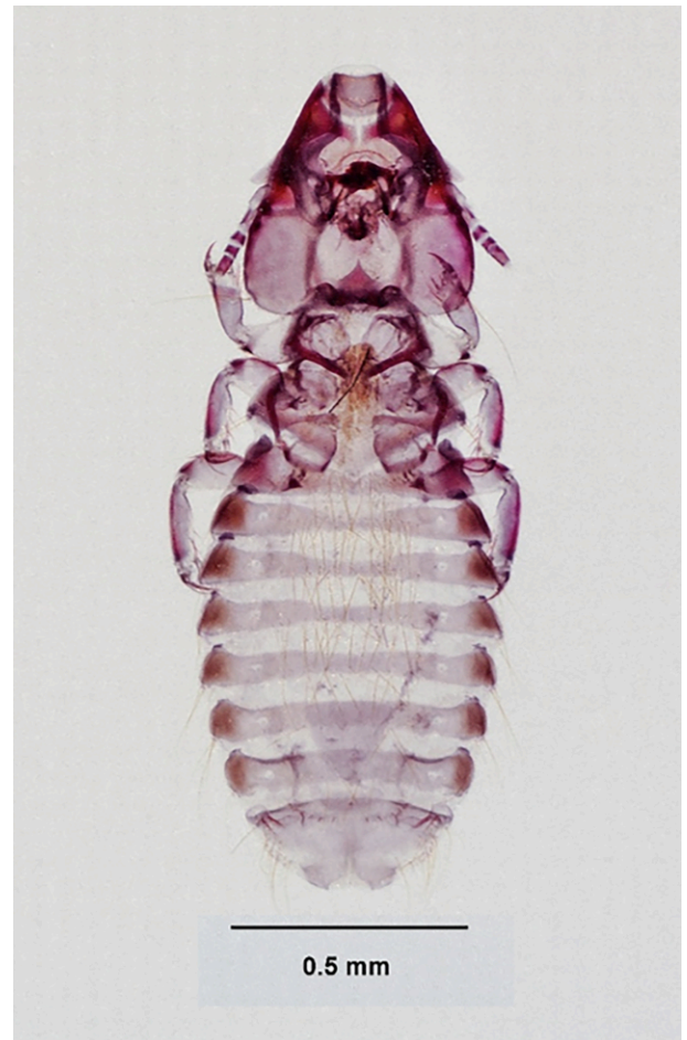
Fig. 3: Los parásitos, como este piojo (Phthiraptera, Rallicola pilgrimi Clay, recogido en junio de 2014, Isla Sur, Nueva Zelanda), que se extinguió cuando su hospedador, el pequeño kiwi moteado (Apteryx owenii Gould), fue trasladado a islas libres de depredadores (Buckley et al., 2012), y que no figura en la Lista Roja, se desconocen casi por completo en la evaluación de las extinciones.

El potencial de conservación de los restos de organismos es importante para evaluar las extinciones, pero existen sesgos inherentes a la conservación que pueden influir en dichas evaluaciones (Plotnick et al., 2016). Por ejemplo, el potencial de conservación de los mamíferos es mucho mayor que el de los anfibios (McCallum, 2007) y el de los vertebrados grandes es mucho mayor que el de los vertebrados pequeños (McCallum, 2015). Entre los invertebrados terrestres, los moluscos son un buen candidato para evaluar las pérdidas de especies, ya que dejan restos duraderos (conchas) en los registros fósiles y arqueológicos cuando mueren (Fig. 4). En las islas, especialmente donde los sustratos de piedra caliza con un alto contenido de calcio permiten la persistencia a largo plazo de conchas vacías (Říhová et al., 2018), muchos